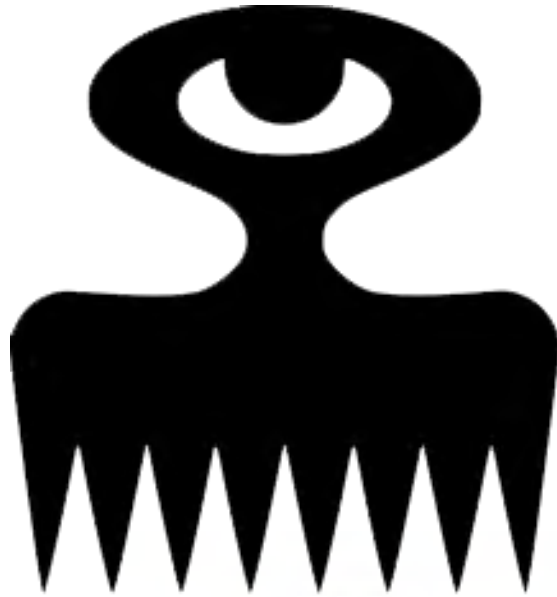
Mfonin 10: Duafe

Nhwehwemu yi de to dwa se saa tete adee a ete sei na ohaw biara nni ho sedefe yehunu wo Kwasi Broni nneem ho no. Ebi koraa enkyer na aseɛ nanso tete dee no de na ekyer yie ansa aseɛ. Yehunu se adwinnee nso ye abebudee ekasa kyere yen. Wei nti mede saa abebudee hyee 'SPEAKING' na edaa adi se botae saa abebudee kyere ne se abere biara a yebehunu no tebea a na yen nananom a enne yi yagya no agyagya mu.