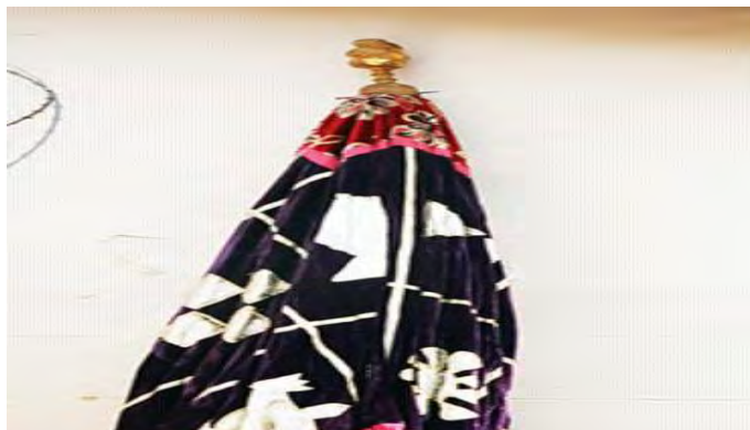
Mfonin 9: Nanakabobonini