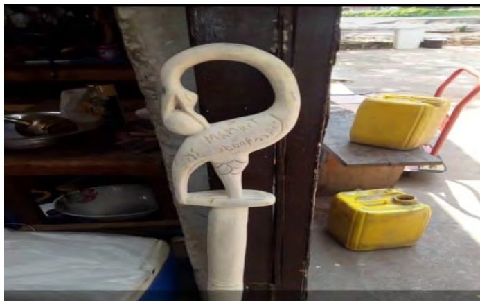
Mfonin 14: Sankofa

“Aane mpaninfoɔ wɔ kasaabebuɔ bi sɛ, “Wo werɛ firi na wo san kɔfa a wonkyiri” Yesene saa nsenkyerenne yi de kyere sɛ, sɛ abɛɛfo nneema aba yi emmoa yen a yɛwɔ ho kwan sɛ yesane fa tete deɛ no na eye papa no sɛdeɛ ebeye ma yen ho betɔ yen” (Opanin a wadi mfee 34, Kumase Cultural Centre).