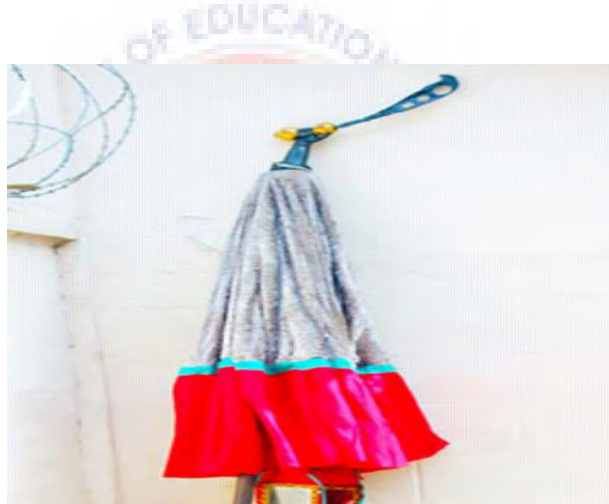
Mfonin 8: Nsa a [kura akofona mu

“Ohene biara a otumi ye biribi boa ne man no ewo se yeye biribi de kyere se watumi aye bi. Teteberε so ahemfo pii na wotumii dii ako de gyeε yen nkuro pii. Eno nti na yeaye saa bankyiniie de kyere se saa ohene no ako agye aman pii” (Opanin a wadi mfee 37, Ahwia).