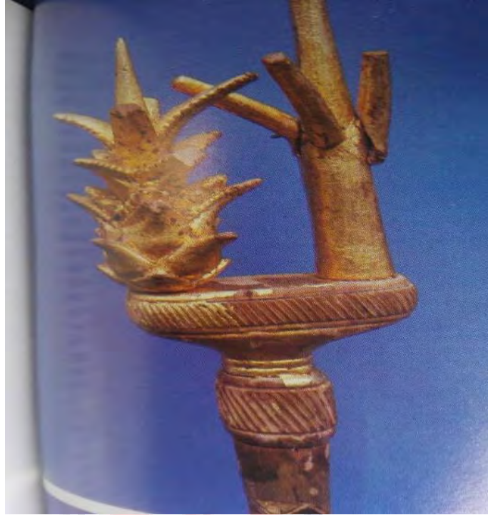
Mfonin 2: Abɛdua a [dua bi ho

Afei, mede saa abɛbudeɛ yi hyɛɛ ‘SPEAKING’ mu na deɛ ɛdaa adi ne sɛ akyeame de saa poma yi de dwuma na mmom ɛnye baabiara kɛkɛ na wɔde di dwuma na mmom baabi a ɔhene a ɛwɔ hɔ no yɛ ɔmanhene. Wei kyere bere ne bea a yede abɛbudeɛ yi di dwuma no hia pa ara.