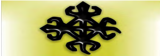
Mfonin 12: Funtunfunefu- dɛnkyɛmfunefu

“Sedee yenim se tekrama ne ese ko no saa ara nso na mmoa mmienu yi nso se wɔredidi a wɔko. Yeye saa adwinnee yi de kyere apereapere ne aniberebere a ekɔ so wɔn ntam” (Ɔpanin a wadi mfee 37, Ahwia).