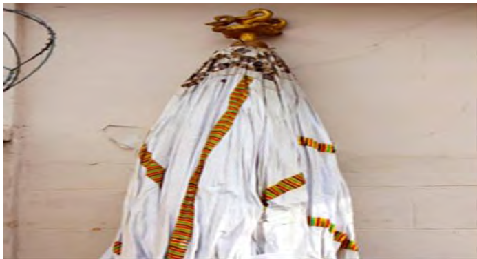
Mfonin 6: Akokɔbaatan ne ne mma

Ɔye akokɔbaatan nti ne nan tia ne mma so nanso ɔnku wɔn” (Ɔpanin a wadi mfee 80, Ahwia).