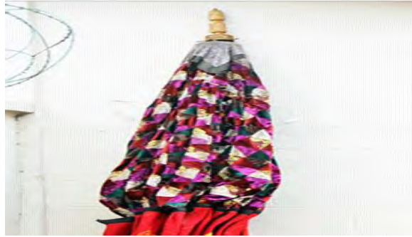
Mfonin 7: Prekesse

Mede saa abebudee yi hyee ‘SPEAKING’ mu na edaa adi se Akanman mu no ohene a ode saa adwinnee yi bedi dwuma no na ne botae ne se obiara behunu mfasoo a ewo ne ho ne atenka a amanfooo no bete.