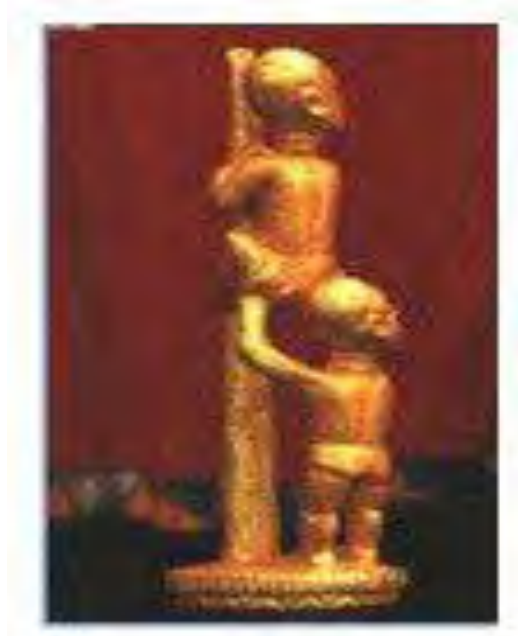
Mfonin 17: ‘Nea ɔforo duapa no na yɛpia no’

“Yɛnim sɛ wei nso yɛ Akanfoɔ mmɛ no ɛmu baako deɛ nanso yɛde ayɛ adwinneɛ ɛfiri sɛ ɔda Akanfoɔ asetena mu nhyehyɛɛ no bi ɛdi” (Ɔpanin a wadi mfɛɛ 35, Ahwia)