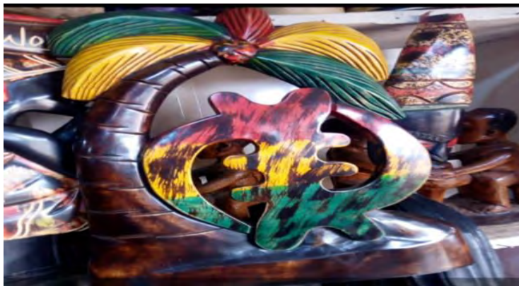
Mfonin 11: Gye Nyame

“Akanfoɔ gye to mu se tumi kɛsɛ bi wɔ hɔ a eso sen tumi biara ɛwɔ asaase yi so na nea ɔkura saa tumi no na ɔbɔɔ wiase ne ɛmu nneema Nyinaa. Wei nti yɛwɔ edin pii a yede kyere saa tumi no. ɛmu baako ne Gye Nyame” (Aberante[ a wadi mfeɛ 35, Ahwia).