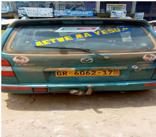
Mfonin 3: Metwe ma Yesu

biara sj cpue abcntene so na cba fie a cde asjm nam. Sj jnyj ntckwa na cbcej a, na wakcsje obi adej a wcde aba fie ama ne maame atua adekodej no ka. Jba no saa a na ne maame werj aho nti berj biara cbjdi bcne a wcde no bjba fi no, nsjm a ne maame taa ka ne sj; “oh! Kofi na menyj wo dejn ansa na woasesa wo suban?” Jnam wei so ma “Oh Kofi no bjyjj ne din. Botaej titire nti a ctwerjj saa ntwerjej ne sj; “oh kofi” akwadaa bcne na jnnj wasesa abjyj onipa papa a watumi atotc ahyjn.