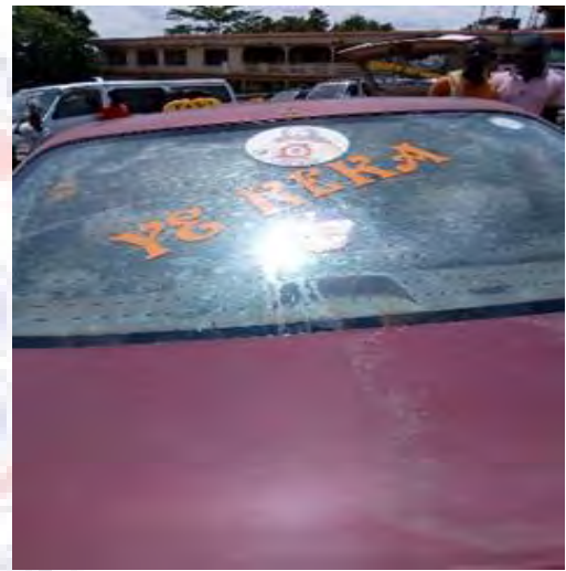
Mfonin 22: Asjda bjn* - Aseda