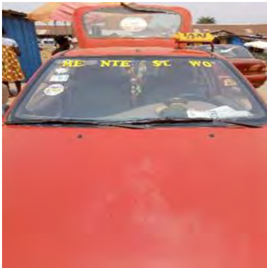
Mfonin 21: *Eddiemea* -jdi me ara bjn?