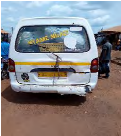
Mfonin 17: *Fakye* - Fa Kyj