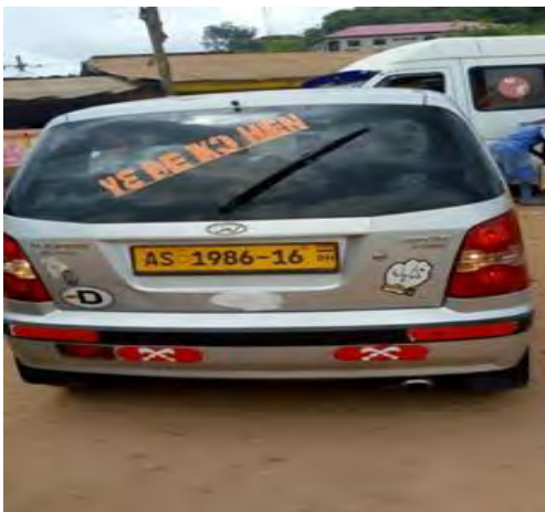
Mfonin 23: *Me nte* sj wo – mente sj wo