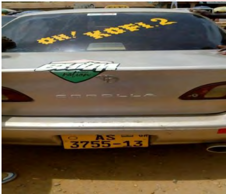
Mfonin 2: Oh! Kofi No. 2

Jha no, me ne ahyjnwuranom, ahyjnkafoc ne ahyjntiafoc twetwee nkcmmc faa ahyjn ho ntwerjej ahodoc no adwene a jtaa akire ne sjeje wcte asej fa. Mmuaj a ahyjnwuranom ne ahyjnkafoc de maa no bi na jdidi soc yi.