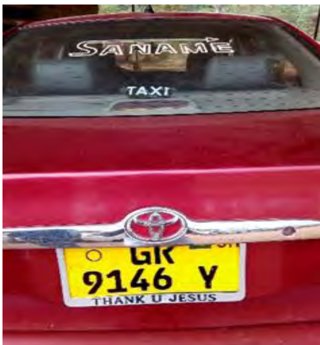
Mfonin 27: *Saname*-sana me