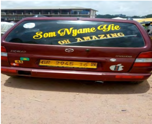
Mfonin 12: Som Nyame Yie

babirara a masi dan asan akctc jhyjn no dej makcgye sikaduro. Saa nsjm a na amamfoc keka no na jmaa metwerjj jhyjn no ho “Amamfoc ano” no.