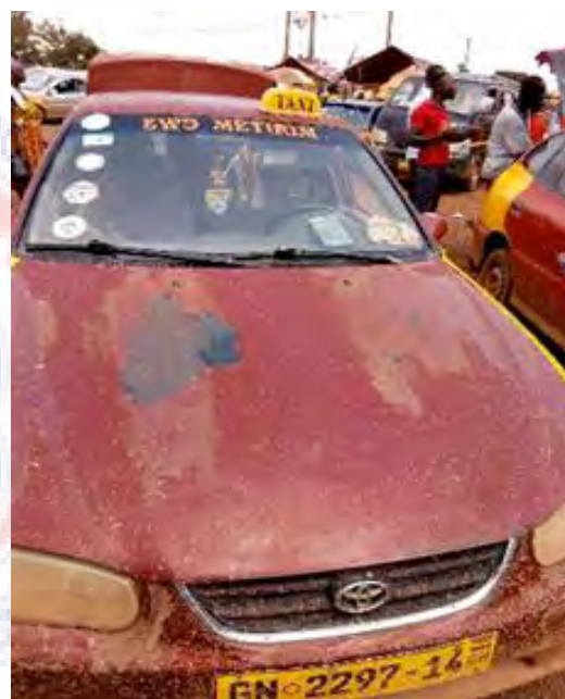
Monin 28: jwc *metirim* – jwc me tirim