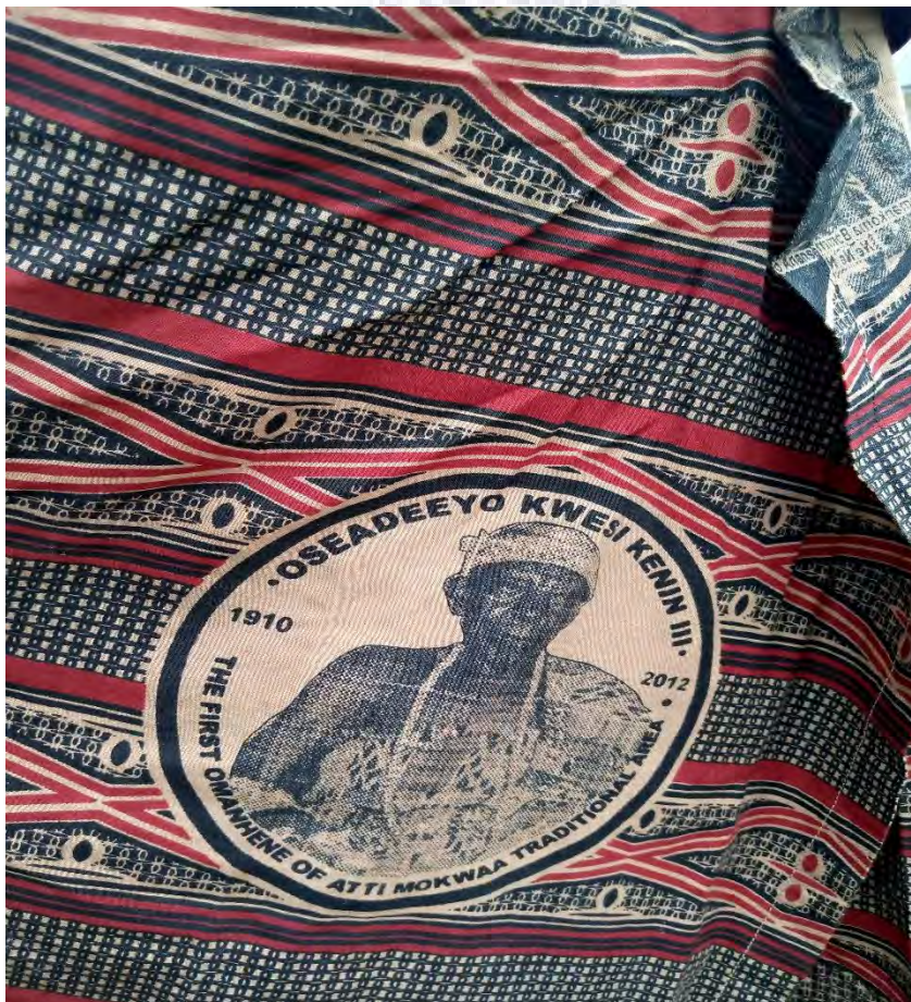
Mfonyin 7: Owufo no mfonyin a w[ɔ]dze twa tam dze y[ɔ] eyi Memenda

Dza odzi kan a mebeƙasa afa ho nye atamtwa na ntartwa. Nde mber yi, se obi wu a, mba na ebusafo no binom tum twa atam na ntar na woye owufo no no mfonyin to mu a wobofura no eyi da no, naaso tsetse no nna onntse dem. Wobo iyi ho kaw pofee. Osor dza woye no Memenda a oye asopon no na osor dza woye anaa wofura no Kwesida no. Kwesida no dze wofura fufuw dze ko ndaasesom. Iyi nyinara ye kaboo na sikasee.